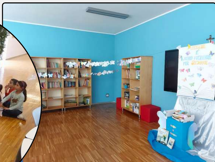
(Scuola Primaria di Barzana)